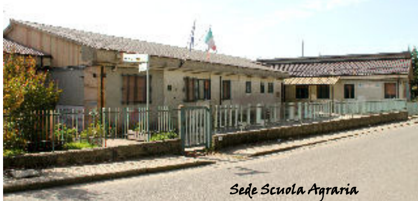
Sede Scuola Agraria

Il nostro Istituto Ist. Socio-sanitario di Soveria Mannelli